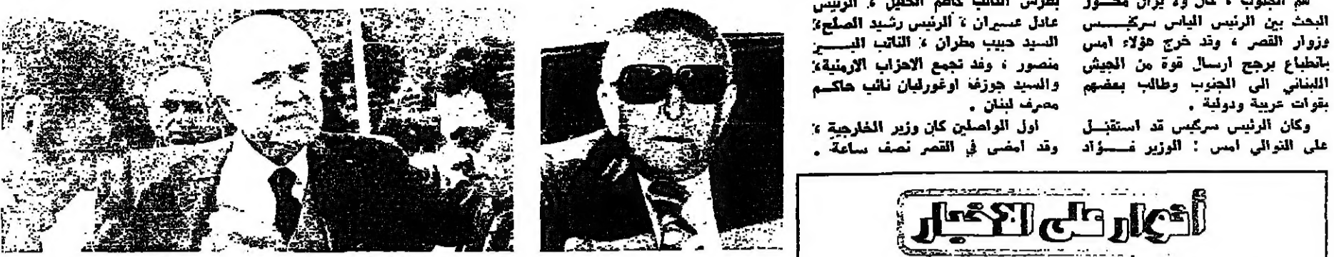
الرئيس عادل عسيران يولي بصرحه

قال الوزير بصرح بعد المظلة: لقد استعرضنا بعض المواضيع التي تتعلق بالسياسة الخارجية، ونظرات الوضع في الأيام الأخيرة، في ضوء التحركات الديبلوماسية والعربية والدولية. هل ان قضية الجنوب ستطرح فعلا في الامم المتحدة؟ هل من يظن ان شيء بهذا المعنى حتى هذه الساعة، الا ان طريق الصفاء. هل من حل عملي قريب للجانب؟ انتظروا شوي... وحسب. التار نشطه او لا نشطه. الخليل: لتتعاون على الحل قال الوزير بصرح بعد المظلة: لقد استعرضنا بعض المواضيع التي تتعلق بالسياسة الخارجية، ونظرات الوضع في الأيام الأخيرة، في ضوء التحركات الديبلوماسية والعربية والدولية. هل ان قضية الجنوب ستطرح فعلا في الامم المتحدة؟ هل من يظن ان شيء بهذا المعنى حتى هذه الساعة، الا ان طريق الصفاء. هل من حل عملي قريب للجانب؟ انتظروا شوي... وحسب. التار نشطه او لا نشطه.